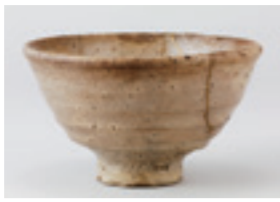
▲高麗茶碗 銘坂本 朝鮮王朝 時代 16世紀 野村美術館蔵

明智光秀の事跡を、光秀や織田信長など彼をめぐる人びとのゆかりの品々や歴史資料をもとに探る展覧会。わずかに残される光秀の所用を伝える作品の中には、いくつかの茶道具がみられます。写真もその一つで、井戸茶碗と呼ばれます。ろくろ目が強く表れているのが印象的で、高台(底の脚の部分)には梅花(かいらぎ)と呼ばれる粒状・ちぢれ状の模様がきれいにみられます。天正8(1580)年に、光秀が主催した茶会で「いと茶碗」が用いられたことが記録に残されています。