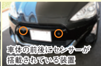
表示機でお知らせする装置