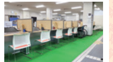
図 南部東事務所(加納城南通1-20 ☎271-0361)、南部西事務所(市橋2-8-18 ☎272-2021)、日光事務所(日光町9-1-3 ☎232-1480)

待合スペースの拡充や車いす対応の窓口カウンターへの入れ替え、ベビーチェアなどを設置するリノベーションを実施し、来所者の利便性・快適性の向上を図りました。昨年実施した西部、東部、北部の各事務所とあわせ、ぜひご利用ください。