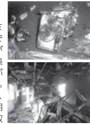
▲小型充電式電池が原因となった火災状況(出典：(公財)電と一体となっている小型充電式電池は、日本容器包装リサイクル協会)

携帯電話やデジタルカメラなどに使用されている小型充電式電池が原因で、全国で多量発生している。火災が発生すると、収集やごみ処理施設の稼働に甚大な影響が及ぼほか、住民に被害が及ぶ恐れがあります。使用済みの小型充電式電池は、毎月1回、各地域の公民館などで行っている、廃食用油・発泡スチロール・白色トレイなどの収集において回収しています。また、小型家電と一体となっている小型充電式電池は、市内12か所(市庁舎・コミュニティセンターなど)の小型家電リサイクル回収ボックスに入れてください。詳しくは、市ホームページや各世帯に配布されている岐阜市ごみ出しのルールをご覧ください。小型充電式電池は、普通ごみや粗大ごみ、ビン・カン・ペットボトルの袋の中に入れて搬出することは危険です。絶対によめてください。☎ 環境一課 ☎214-2418