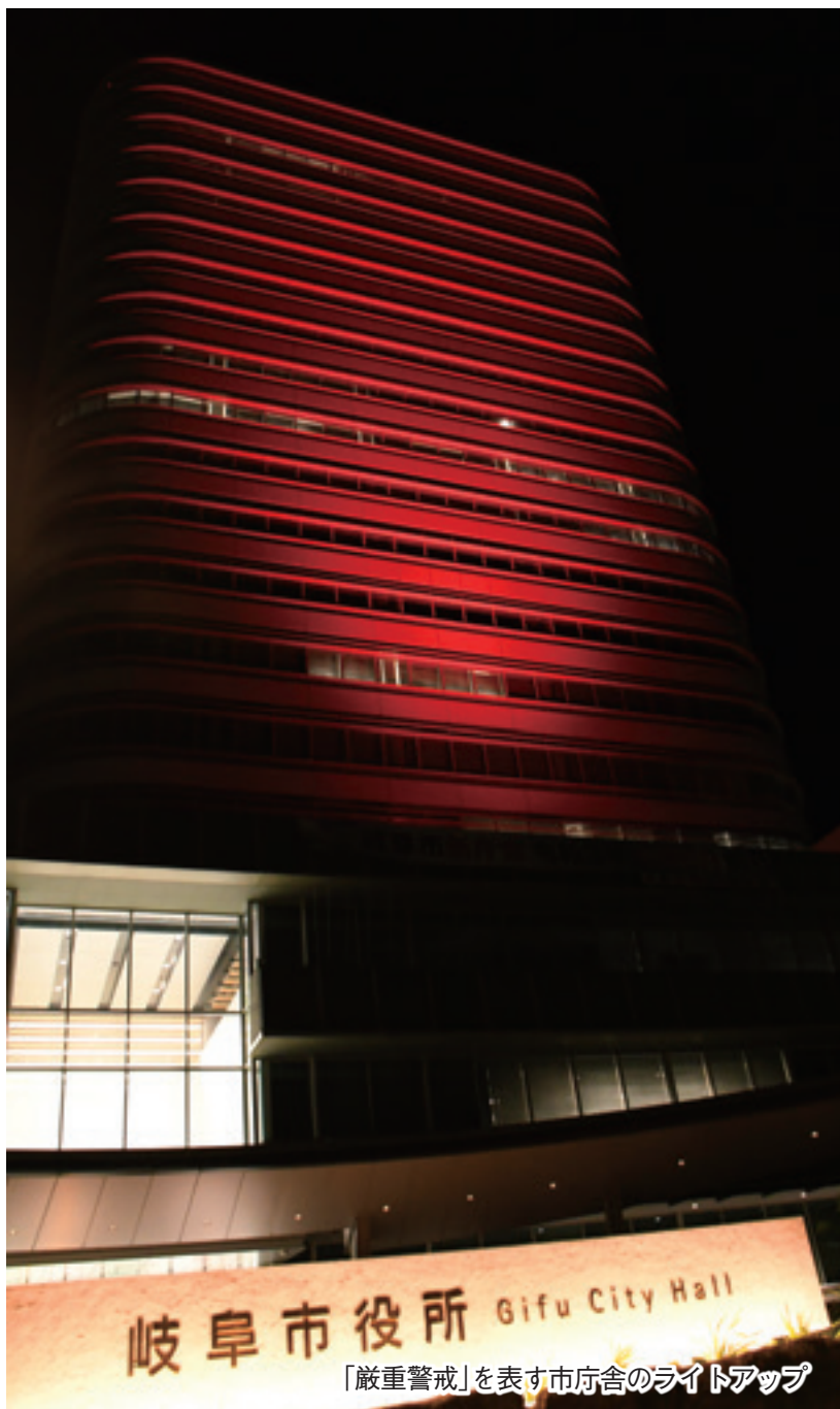
「嚴重警戒」を表す市庁舎のライトアップ