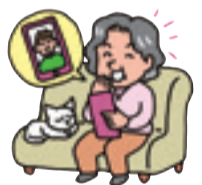
▲テレビ電話をしている様子

◆日時・内容 ①買う前のスマホ体験=6月9日(水)午前10時～正午 ②スマホ決済+スマホ活用術=6月15日(火)午後1時～3時 ※どちらかみの受講も可 ◆対象者 市内在住の60歳以上の人 ◆定員 各14人 ◆受講料 無料 ◆申込・場所・☎ 5月31日(月)までの午前9時～午後5時(日祝日は除く)に電話または直接老人福祉センター友楽園(京町1-64・☎263-6767)へ。申込者多数の場合は抽選。※スマートフォンを所有していなくても受講可。また受講中はスマートフォンを貸し出すため持参不要。