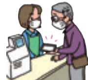
▲スマホ決済をしている様子