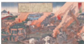
▲「岐阜市街大地震之図」

130年前の明治24(1891)年10月28日に発生した濃尾地震は、岐阜県美濃地方や愛知県尾張地方を中心に甚大な被害をもたらしました。この資料は、岐阜市街の被害の様子を伝えるために作成された