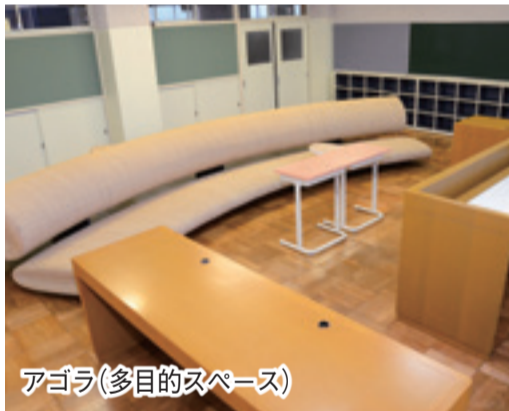
アゴラ(多目的スペース)