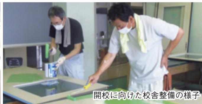
開校に向けた校舎整備の様子

4月開校の「市立草潤中学校」は、東海地区で初めての公立の不登校特例校です。地域の人や学校校務員などの協力により、開校までの準備が進められてきました。学校では、「ありのままの君を受け入れる新たな形」をコンセプトに、生徒の実態に配慮した特別の教育課程を編成し、少人数指導で個に応じた学習・体験ができる、特色ある教育を行っていきます。☎ 学校指導課☎214-2193【関連記事】6面に掲載