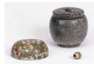
重要文化財 舍利容器(左:唐三彩碗、右上:石製舍利容器、右下:鉛ガラス製内容器) 奈良時代 文化庁蔵 朝日町歴史博物館保管

岐阜も舞台となった壬申の乱(672年)の経緯や古代の美濃の国の様子を紹介する展覧会。乱後、勝利した天武天皇は味方になった美濃国などの地方豪族に対して、当時の最新技術の結晶ともいえる寺院の建設を支援したと考えられています。現在の三重県域には、いくつかの古代寺院の存在が知られています。