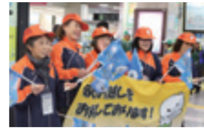
▲ねんりんピック和歌山大会 駅歓迎の様子

■ねんりんピック(全国健康福祉祭)とは？ 60歳以上の方を中心として、あらゆる世代の人たちが楽しみ、交流を深めることができる、スポーツ、文化、健康と福祉の祭典。