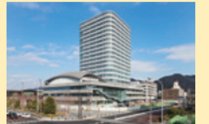
▲南西側からの外観

3月末にはすべての新庁舎建設工事が完成します。そして、4月中旬から5月下旬にかけて、段階的に各部署が新庁舎へ移転し、業務を開始します。各部署の業務開始日は、広報ぎふ4月1日号に掲載予定です。