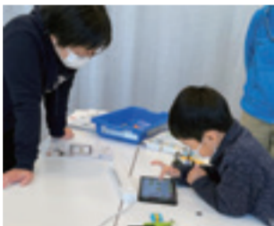
過去の番組の一部は岐阜市公式YouTubeチャンネルでも! => 岐阜市 動画

【おみどころ】5日(金)/市民活動支援事業 市では、市民と行政が「協働のまちづくり」を進めています。多くの市民団体が地域社会の課題を解決するために活動し、市はそうした活動にアドバンスのほか「市民活動支援事業」という助成金による支援を行っています。 番組では、今年度支援事業に採択された団体のうち、CoderDojo岐阜とおとなのキャリア支援室の2団体を取り上げ、採択事業の活動の様子をお届けします。ぜひ、ご覧ください。