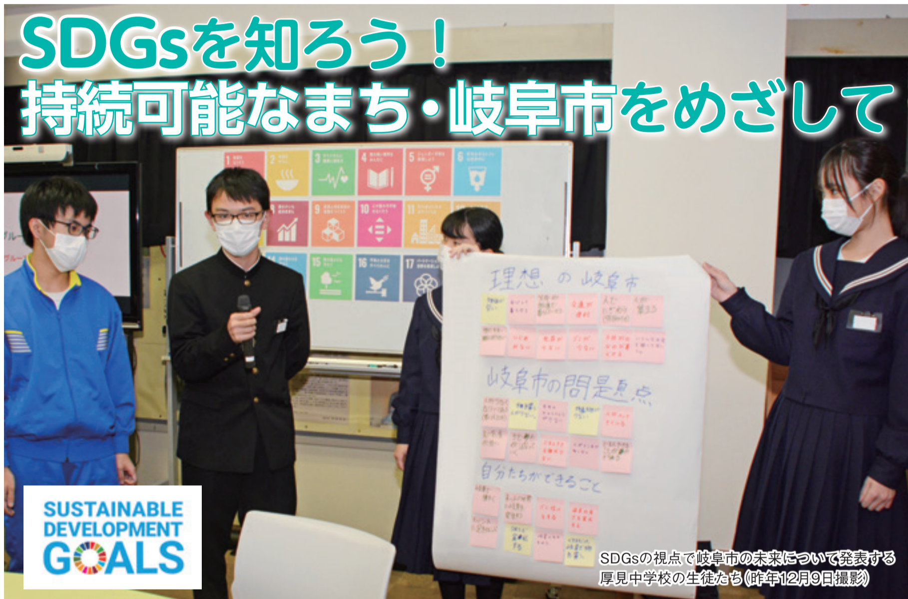
SDGsの視点で岐阜市の未来について発表する厚見中学校の生徒たち(昨年12月9日撮影)

市内小中学校などで岐阜市の未来を考えるワークショップを開催し、国連サミットで採択された持続可能な開発目標“SDGs(エスディーゼーズ)”を私たちの身近な課題と結びつけながら学んでいます。将来を担う若い世代の意見を多く取り入れながら、持続可能な都市づくりを進めていきます。