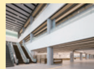
▲1階エントランスモジュール