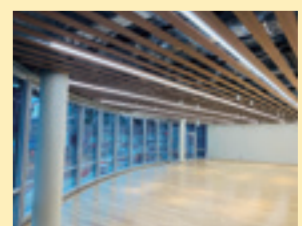
▲1階交流スペース「ミンナト」