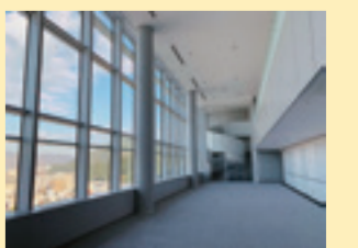
▲15階、17階展望スペース「つかさデッキ15、17」