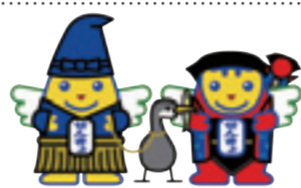
明るい選挙イメージキャラクター 鶴岡めいすいくん、さるぼほめいすいくん