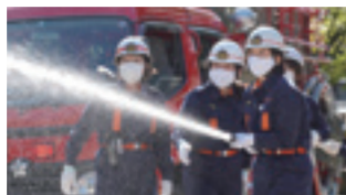
写真上 / 道路や民家への流入を防ぐ土のう積み 写真下 / 女性消防団員による放水訓練