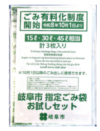
「指定ごみ袋お試しセット」

指定ごみ袋の販売開始(8月1日～)に先立ち、実物を手に取っていただける機会として、家庭用の指定ごみ袋(45・30・15ℓ各1枚)とチラシが入った「指定ごみ袋お試しセット」を全戸配布します。