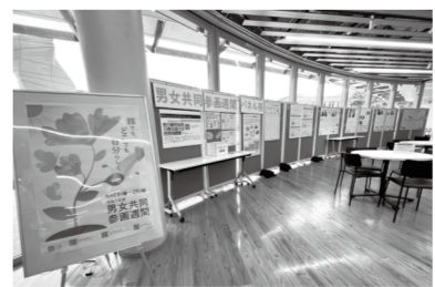
▲昨年の市庁舎でのパネル展の様子

※「男女共同参画週間」とは…男女が、性別にかかわらず、その個性と能力を十分に発揮することができる男女共同参画社会の実現に向け、男女共同参画社会基本法の制定日に合わせて設けられています。