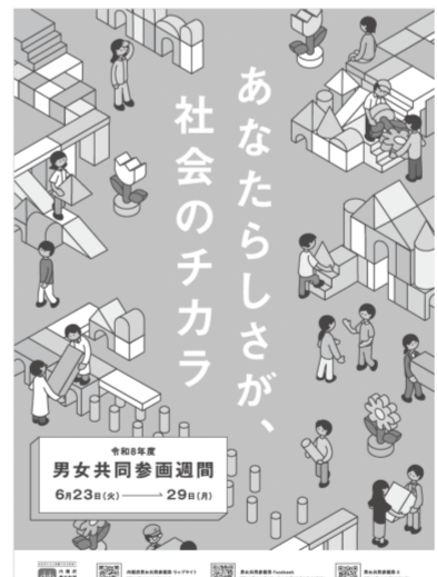
▲令和8年度男女共同参画週間ポスター

6月23日～29日は、「男女共同参画週間*」です。男性も女性も、職場で、学校で、地域で、家庭で、それぞれの個性と能力を発揮できる「男女共同参画社会」の実現のためには、市民の皆さん一人一人の取り組みが必要です。