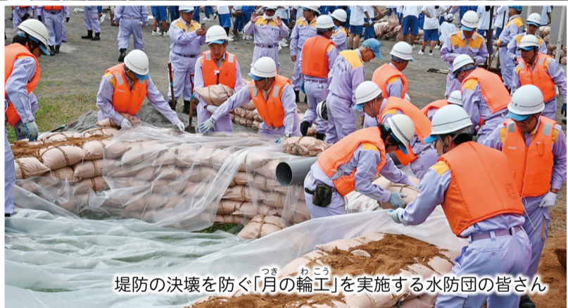
堤防の決壊を防ぐ「月の輪工」を実施する水防団の皆さん

市では、水害から地域を守り、災害時の被害を軽減するため、水防団が活躍しています。