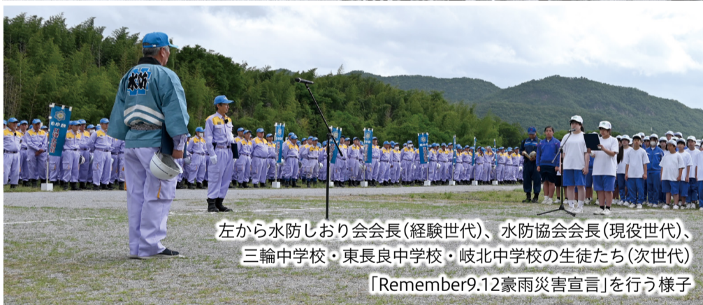
左から水防しおり会会長（経験世代）、水防協会会長（現役世代）、三輪中学校・東長良中学校・岐北中学校の生徒たち（次世代）「Remember9.12豪雨災害宣言」を行う様子