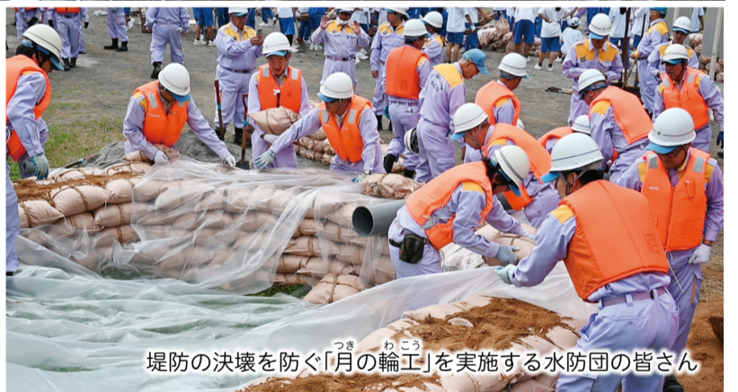
堤防の決壊を防ぐ「月の輪工」を実施する水防団の皆さん

市では、水害から地域を守り、災害時の被害を軽減するため、水防団が活躍しています。