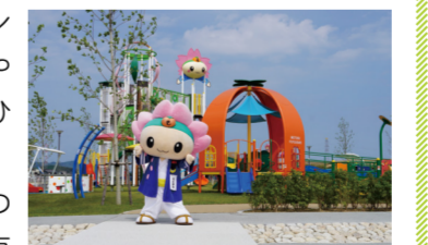
▲もとまると触れ合えるイベントも定期開催