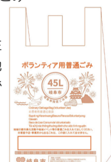
ボランティア用(イメージ)▲