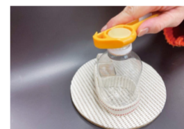
▲ふたが開けやすくなる自助具(固定台)