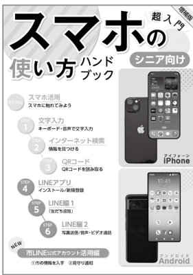
▲「スマホの使い方ハンドブック」増補版