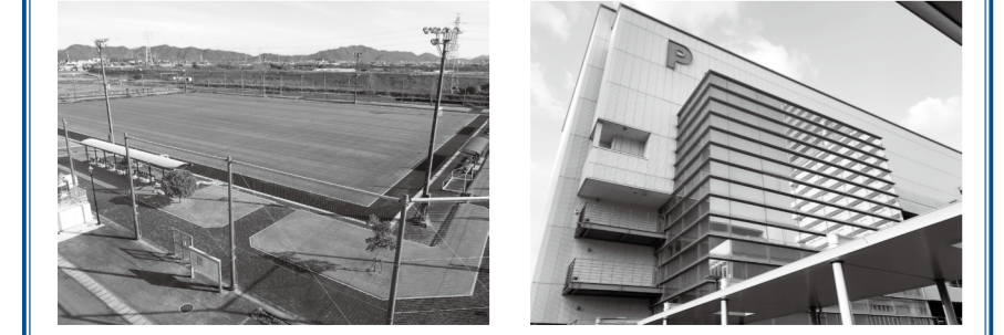
関 行財政改革課 ☎214-2069