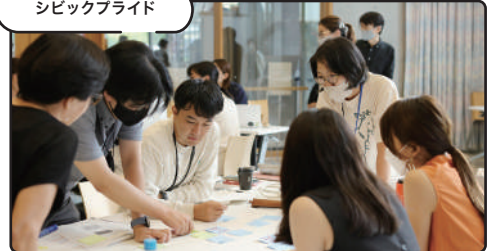
シビックプライド