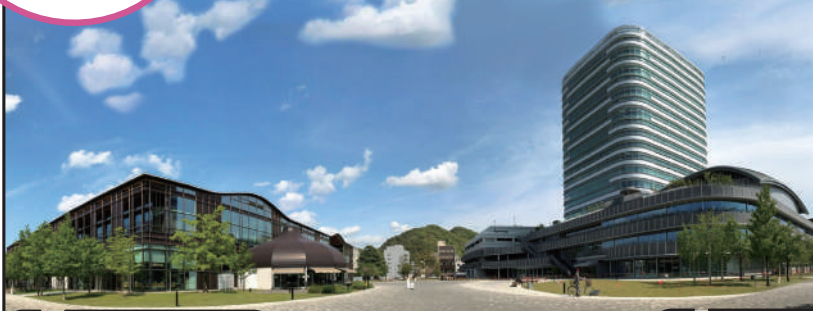
みんなの森 ぎふメディアコスモス