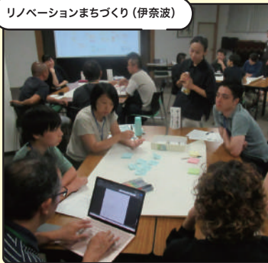
リノベーションまちづくり (伊奈波)