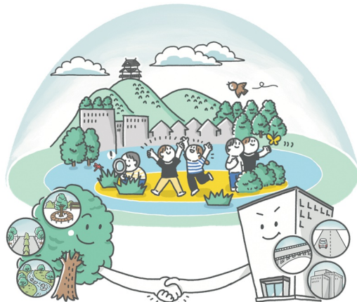
図 グリーンインフラのイメージ

岐阜市グリーンインフラ計画における「グリーン（緑）」は 樹木や花、土壌、水、風、地形 を含んだ様々な緑を対象としています。