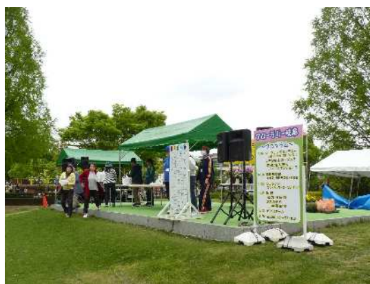
フローラリーー岐阜