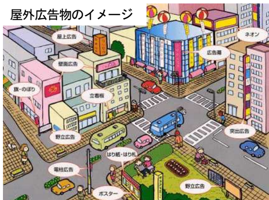
屋外広告物のイメージ

屋外広告物は、私たちに必要な情報を提供してくれるとともに、まちを活気づけるものですが、誰もが目立とうとして無秩序に掲出されると、広告物本来の役割である情報伝達機能が低下するばかりでなく、まちの美観や風致を損ねることになります。また、設置や管理が適切に行われないと、破損等により公衆に危害を及ぼす可能性があります。