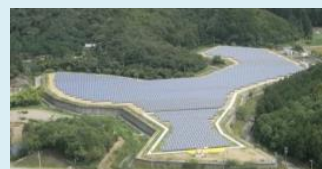
うらぎょう きたのあわらいっばんはいきぶつさいしゅうしょぶんじょう (埋め立てが終了した北野阿原一般廃棄物最終処分場)