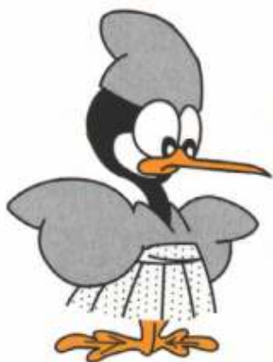
岐阜市のキャラクター「うーたん」