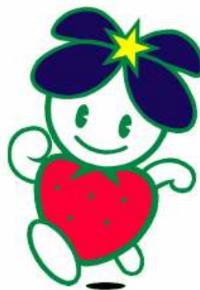
旧柳津町のキャラクター「やなちゃん」