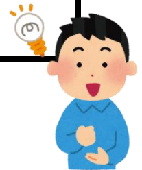
4つのフレームの内容