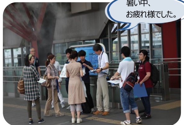
まずはJR岐阜駅前に集合