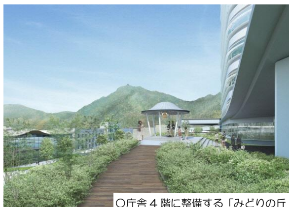
○庁舎4階に整備する「みどりの丘」