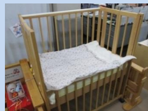
▲授乳室に設置するベビーベッド