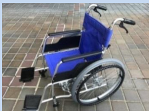
▲来庁者貸出用の車いす