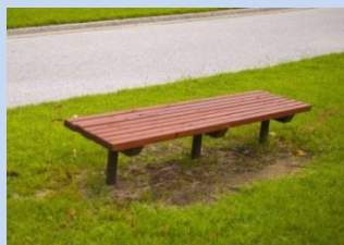
▲みどりの丘に設置するベンチ