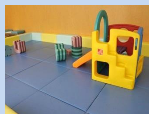
▲キッズルームの遊具やおもちゃ