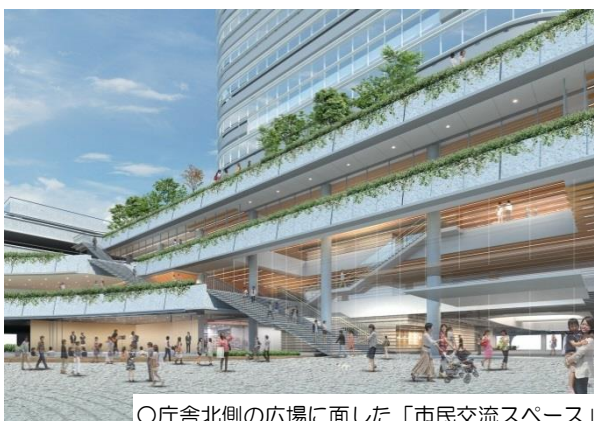
○庁舎北側の広場に面した「市民交流スペース」