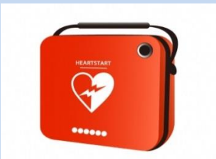
▲救命活動に使用する AED