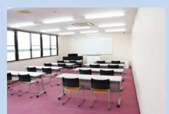
▲会議室で利用する机やイス