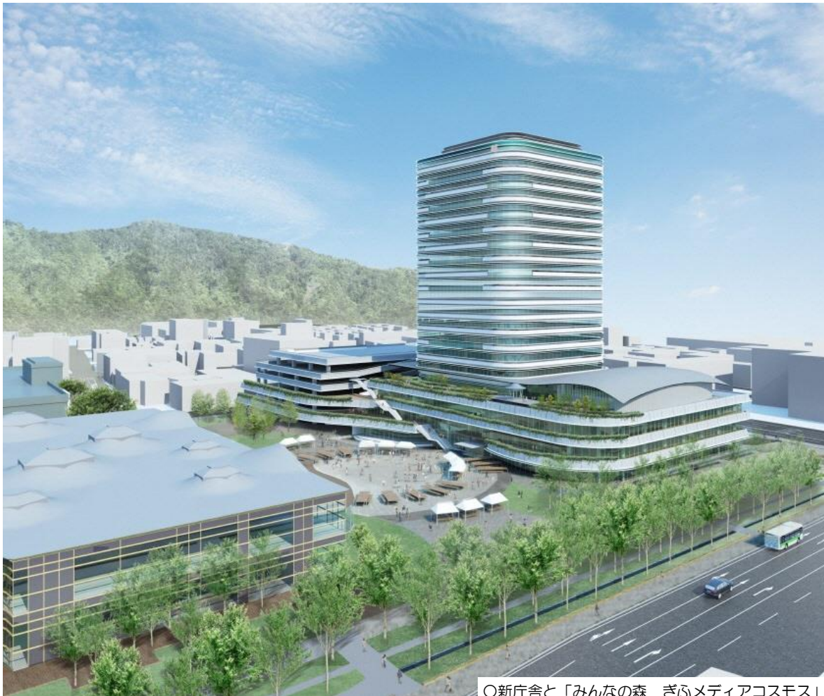
○新庁舎と「みんなの森 ぎふメディアコスモス」