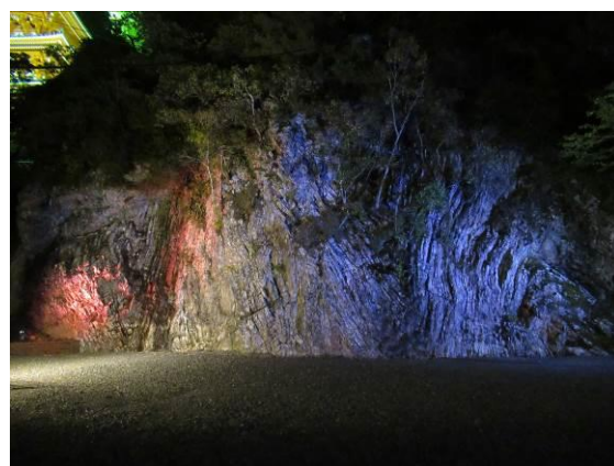
ライトアップイメージ