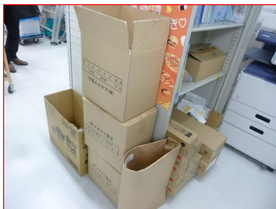
事務所にて段ボールを利用し OA用紙を分別