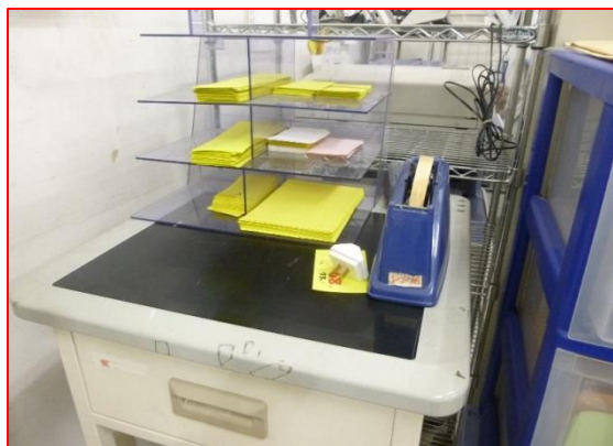
使用済みPOP紙の分別棚