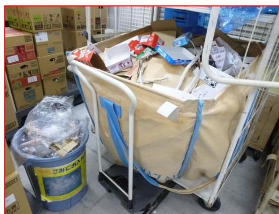
バックヤードにて大きな袋を利用し 雑がみ類を分別