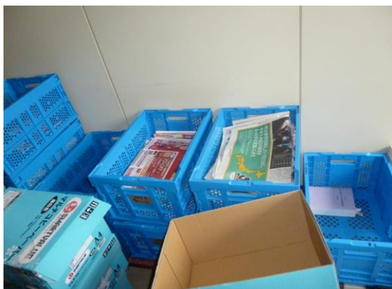
バックヤードの紙類分別ボックス (チラシ、新聞、カタログ類)