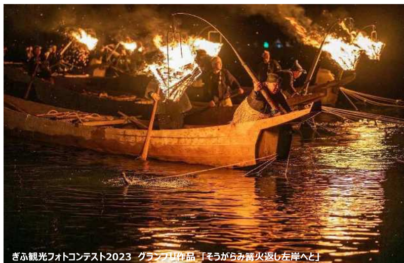
ぎふ観光フォトコンテスト2023 グランプリ作品「そうがらみ篝火返し左岸へと」