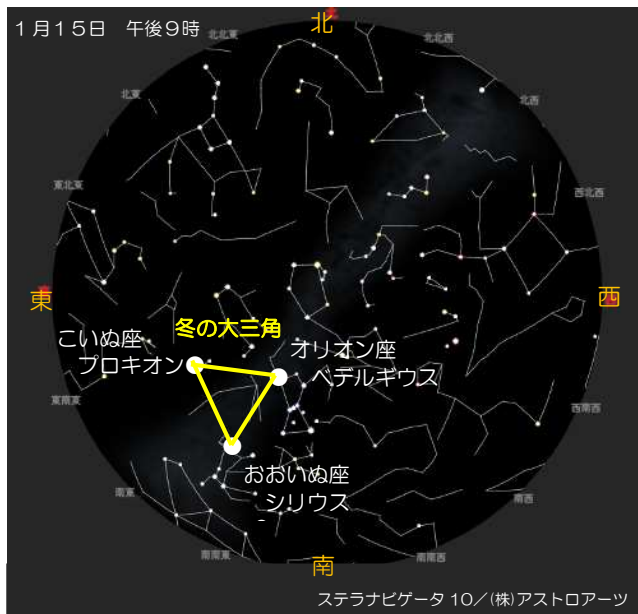
ステラナビゲータ 10 / (株) アストロアーツ

3つ目の星は「こいぬ座」の「プロキオン」だよ。犬の前という意味があるよ。それは、おおいぬ座のシリウスより先に東からのぼるからだよ。プロキオンともう一つの星（3等星）を結んだ星の並びがこいぬ座だけど、そこから犬の姿を想像するのは少し難しいかもしれないな。