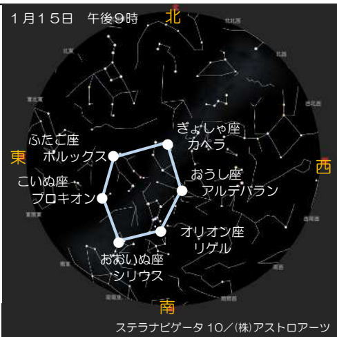
ステラナビゲータ 10 / (株) アストロアーツ

この6個の星は、星の表面温度の違いから、それぞれ色が違うのだ。ぜひ、このきらびやかな星空を楽しんでほしい!!