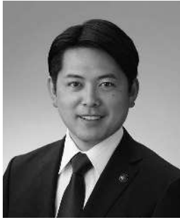
長良川大学学長 柴橋 正直