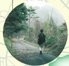
権現山山中を往く人