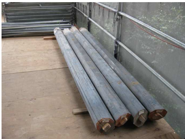
軒を支えていた支柱。