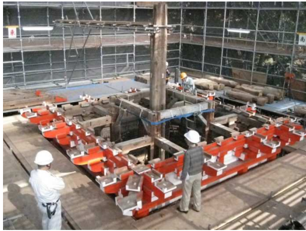
二重の解体の様子。