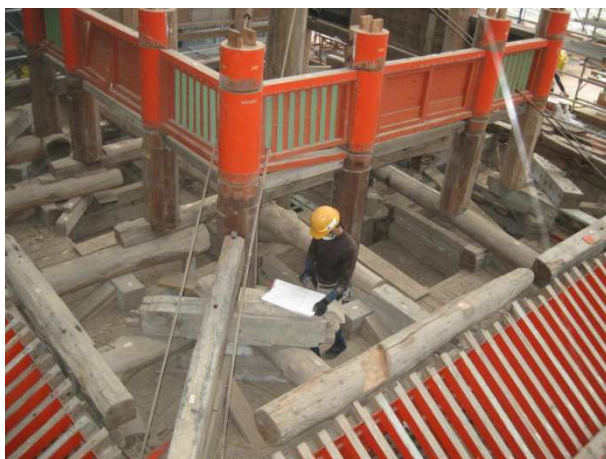
初重の調査の様子。