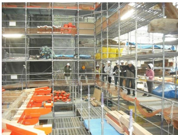
足場から見学の様子 2