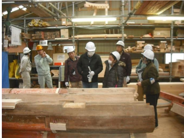
保存小屋の見学の様子

次回、第3回現場見学会を来年度中に開催する予定ですので、ご参加をお待ちしております。