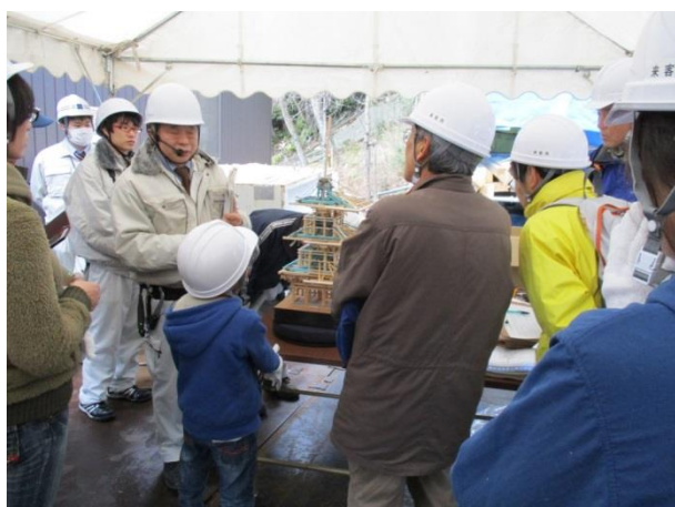
模型による構造説明の様子