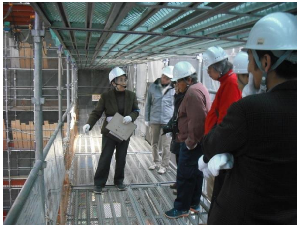
伊藤平左工門建築事務所による説明の様子