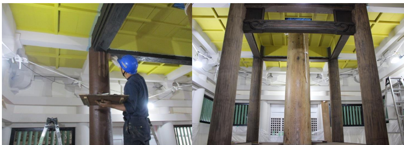
初重須弥壇の塗装に着手しました。下地としてうるしを塗っています。