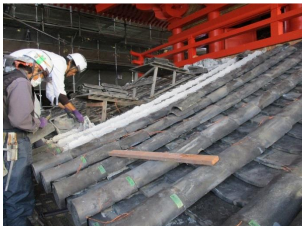
初重の屋根瓦を施工しています。