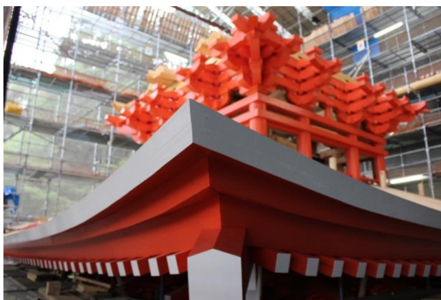
軒の反りが出来上がりました。