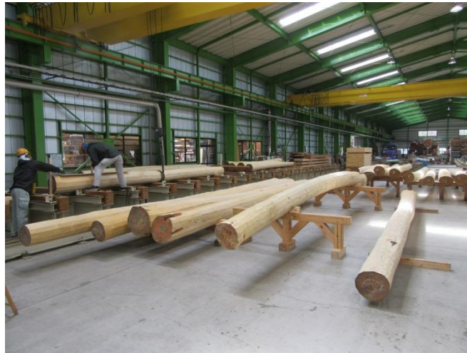
二重の桔木を加工しています。(木材工場にて、取換新設)