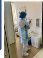
各部屋出口手前の室内でPPEを脱いで手指衛生