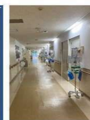
各部屋前にPPE置き場を

作図：国立病院機構長良医療センター 加藤達雄統括診療部長 安江亜由美感染管理認定看護師