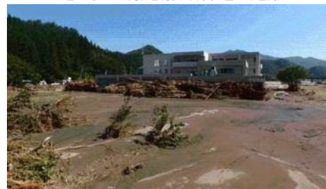
9名が死亡した高齢者施設（写真：国土地理院）

避難準備情報は発令されていたが、 ・避難するべきか ・どう行動すべきか ・避難準備情報が どういう趣旨の情報か が分からなかった。