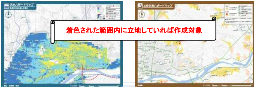
洪水ハザードマップ