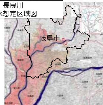
長良川 浸水想定区域図

(左図) 長良川の浸水想定区域 ・市街地の広範囲が浸水する。 他の河川と合わせると 市全体の7~8割の施設が 策定対象となる