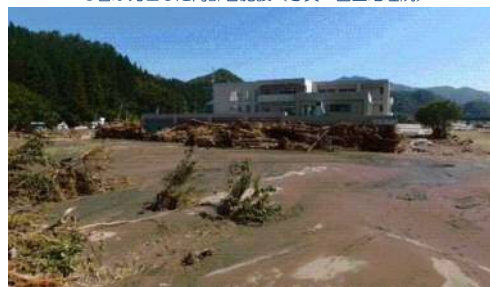
9名が死亡した高齢者施設

避難準備情報は発令されていたが、 ・避難するべきか ・どう行動すべきか ・避難準備情報が どのような趣旨の情報か が分からなかった。