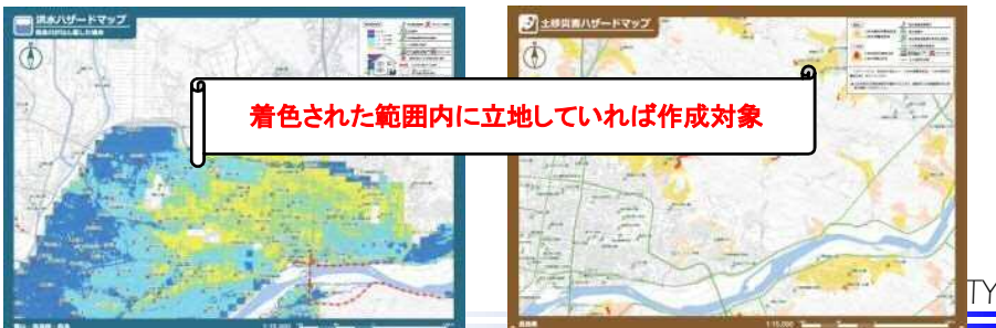
洪水ハザードマップ