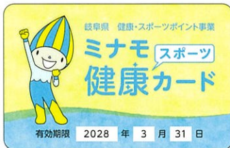
▲ミナモ健康スポーツカード