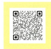
▲協力店に関する情報はこちら