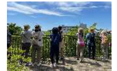
クアオルト健康ウォーキング

クアオルト健康ウォーキングは、心身の健康づくりのために、ドイツのクアオルト(療養地・健康保養地)で自然の地形や風等を活用して行われている運動療法を基に考案されました。