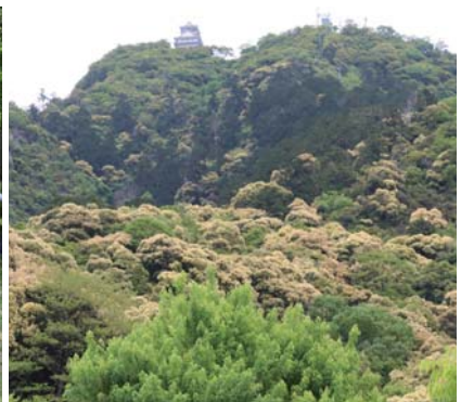
第一回訪問(コース調査の様子)