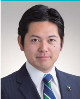
柴橋 正直 市長