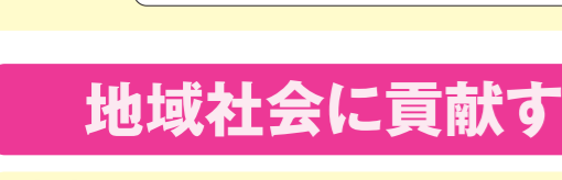
6/12 当日、謎解きブースで活動

楽しく充実した活動です 小学生の時に参加した科学教室でお世話になったボランティアの人に憧れ、参加をしています。「科学館が楽しい。」「理科が好き」と思ってもらえるお手伝いができてとても楽しいです。