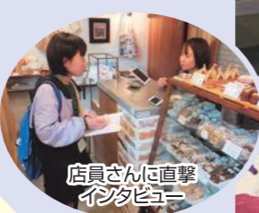
店員さんに直撃インタビュー