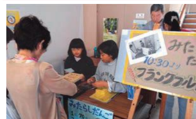
お金の計算はお任せを! 中学2年生