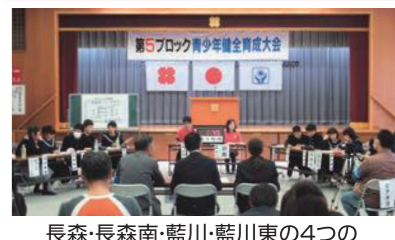
長森・長森南・藍川・藍川東の4つの中学校生がディベートで論戦!