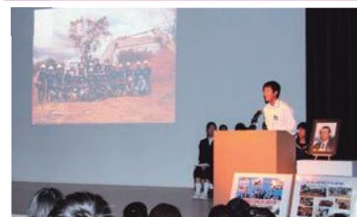
肌で感じ、学んだことを自信をもって発表!