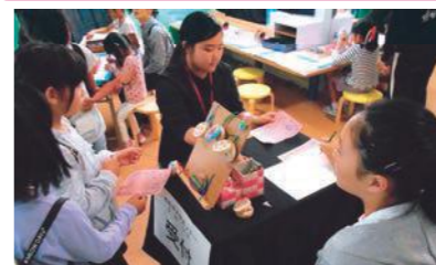
ジュニアリーダー(中学生)もブースを担当