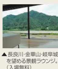
▲長良川・金華山・岐阜城を望める景観ラウンジ。(入場無料)