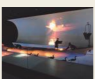
クイズや仕掛けもある展示室 ▼