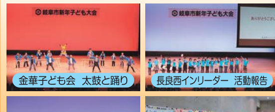
金華子ども会 太鼓と踊り 長良西インリーダー 活動報告

岐阜市の23の子ども会の小学生が、仲間と活動してきたこの一年間の成果を発表しました。皆とてもいい表情で、堂々と発表ができていました。また、会場となった長良川国際会議場のロビーには、子ども会活動の様子をまとめた壁新聞も展示され、互いの活動を知り合うとてもよい機会となりました。