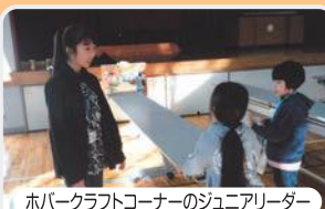
ホパークラフトコーナーのジュニアリーダー