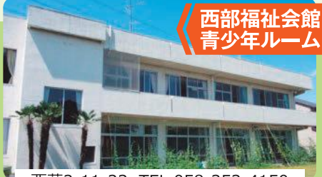
西部福祉会館 青少年ルーム 西荘2-11-23 TEL.058-252-4150