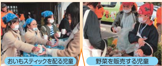
おもいスティックを配る児童 野菜を販売する児童

6月の田植え体験に始まった「農業体験活動」のしめくくりとなる行事で、長森西子ども会と長森東子ども会から合計70名をこえるインリーダーが参加しました。食べ物コーナーや野菜販売コーナーなどで、どのインリーダーも自分の役割に責任をもって活動することができていました。