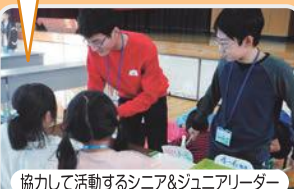
協力して活動するシニア&ジュニアリーダー

ゲームに参加する小学生みんなに喜んでもらえるように、どの子にも分かりやすい丁寧な言葉を使うこと、親しみのある優しい笑顔を大切に活動することができました。(本荘中学校ボランティアスタッフ)