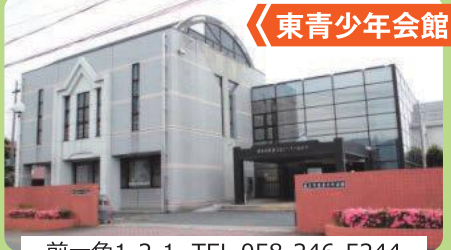
東青少年会館 前一色1-2-1 TEL.058-246-5244

施設や部屋などはそれぞれ異なりますので、まずは一度、気楽に問い合わせてください。また、どの会館でも「相談」を受け付けています。困ったことや悩みごとがあったら相談してね。