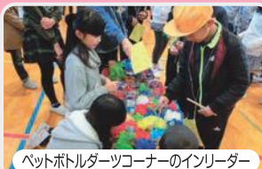
ペットボトルダーツコーナーのインリーダー