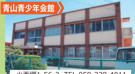
青山青少年会館 小西郷1-56-2 TEL.058-239-4011