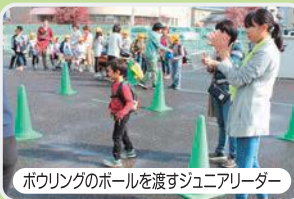
ボウリングのボールを渡すジュニアリーダー