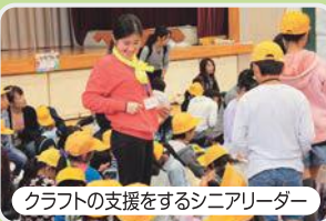
クラフトの支援をするシニアリーダー

今日はボウリングのピンを並べる仕事をしました。自分の仕事に責任をもって、テキパキと行うことができました。小さい子たちがゲームを楽しんでくれて、うれしかったです。(5年生インリーダー)