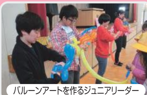
バルーンアートを作るジュニアリーダー