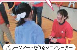
バルーンアートを作るシニアリーダー

小学生の時にこのフェスでバルーンをもらって、自分もやりたいと思っていました。バルーンアートをジュニアリーダーの研修会で学んで、こうして作る側になれたことが本当にうれしいです。(中学生ジュニアリーダー)