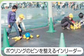
ボウリングのピンを整えるインリーダー