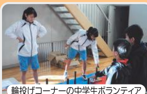
輪投げコーナーの中学生ボランティア