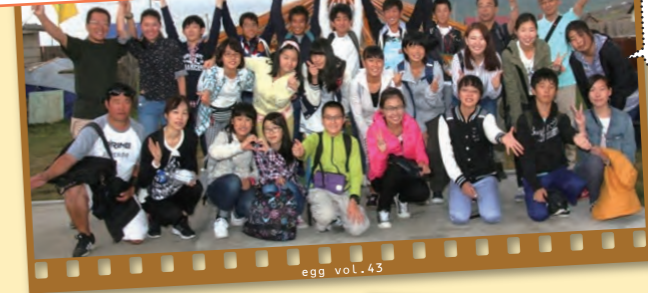
市内の中学生16人が派遣 民家訪問先にて

岐阜市青少年国際教育 夢プロジェクト事業「夢inモンゴル」 平成27年 8月17日~24日