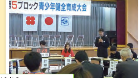
10/18 第5ブロックディベート大会 4校の中学生が熱弁対決!