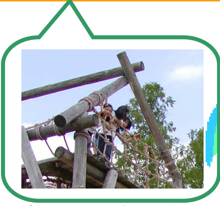
ゴールからのながめは最高！