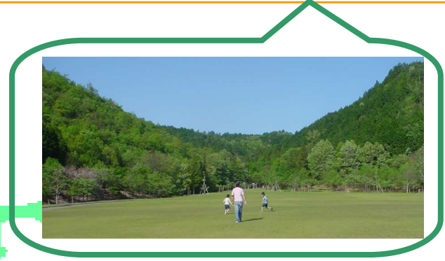
岐阜市でいちばん広い公園だよ