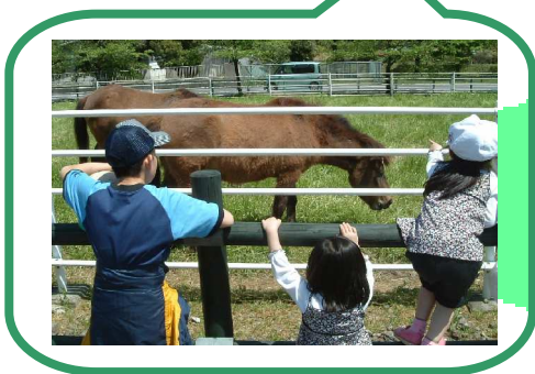
動物たちに会いにいこう！