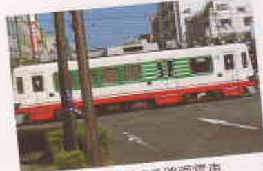
金華橋通りを横断する路面電車