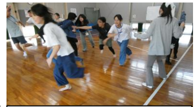
「動」タイプの「ねことねずみ」

【実践】前半はシニアリーダーがGM（ゲームマスター）となり、6つのゲームを体験しました。