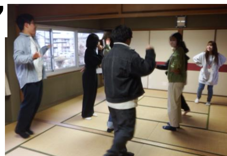
1ブロック・「進化じゃんけん」

十八番にしようと思うレクリエーションは、みんなの前でやってみることで本物になりますよ。