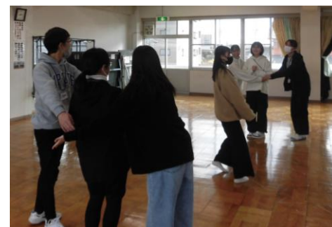
4ブロック・「木こりととりす」