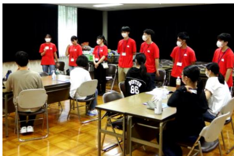
【オリエンテーション】

開会式では、まだ緊張気味のジュニアリーダーたちに対して、雰囲気や和らげようと、シニアリーダーたちが個性的な自己紹介をしてくださいました。集まったジュニアリーダーたちのやる気も伝わる会でした。